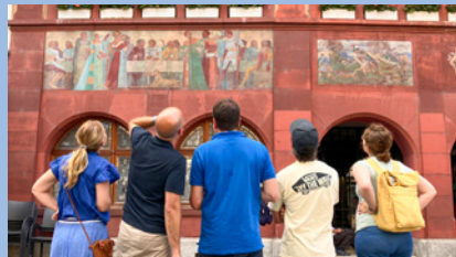
Gäste auf Stedtlischatzsuche